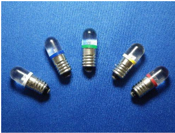
DS10 10Φ 砲弾型 外形寸法 10Φ×29mm