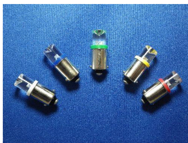
DB09 8Φ 平型 外形寸法 10Φ×25mm