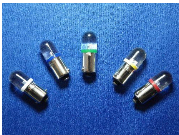
DB09 10Φ 砲弾型 外形寸法 10Φ×29mm